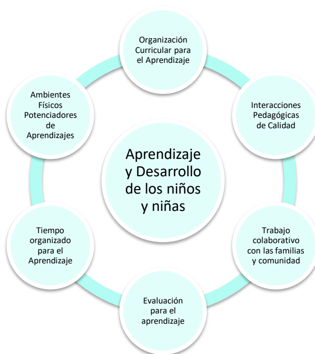
Esquema N° 1: Componentes del Modelo Pedagógico de Educación Inicial Comunal

En cuanto modalidad curricular, se propone un Curriculum Autodeterminado , inspirado en la Filosofía Reggiana, el Curriculum Cognitivo/High Scope y en los aportes de Emmi Pikler, en cuanto concepción de infancia y características de la educación en la etapa inicial, pero contextualizado al ideario antes descrito y a la realidad sociocultural. En este sentido, se propone un Modelo Pedagógico compuesto por seis elementos esenciales, que en su totalidad están al servicio de la construcción de aprendizajes y del desarrollo de los niños y niñas y se inspiran tanto en la Filosofía Reggiana como en el Curriculum Cognitivo/High Scope y en los aportes de Emmi Pikler.